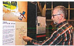
BEWONERS DENKEN MEE OVER KARAKTER LISSERBROEK