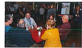
DORPSBEWONERS IN GESPREK