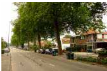
1. historisch lint.

oost-west gericht. Dit mede door de toegangsweg Robert Kochstraat, die als uitvloeisel van de afslag A9 niet aansluit op de oriëntatie van de vooroorlogse bebouwing. Het aantal doorgangen onder de snelweg is beperkt waardoor gescheiden woonfragmenten ten noorden en ten zuiden van de snelweg ontstaan.